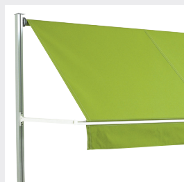
Fallarmar med justerbar fjäderspänning för optimal dukspänning.